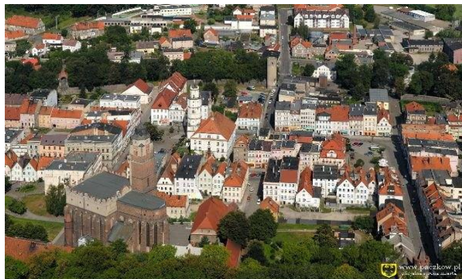
Fot. 1 Rynek Paczkowa - pomnik historii

W listopadzie b.r. Prezydent RP Bronisław Komorowski nadał paczkowskiej starówce prestiżowy status pomnika historii. W województwie opolskim posiadają go jedynie dwa zabytki: Góra Św. Anny oraz nyska bazylika. W całym kraju jest około 50 takich obiektów.