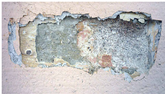
Fot. 2 Stratygrafia jednej z odkrywek. Od warstwy zewnętrznej występuje: różowa farba, zacierka z zaprawy 2mm, ugrowa farba, ugrowszara farba (gruba warstwa), czerwień (cienka warstwa), biel, zaprawa wapienna (tynk)

W trakcie prac na miejscu wykonano szereg odkrywek schodkowych ukazujących mnogość warstw pojawiających się wraz z kolejnymi remontami elewacji, a przede wszystkim zmian kolorystyki, na przestrzeni czasu.